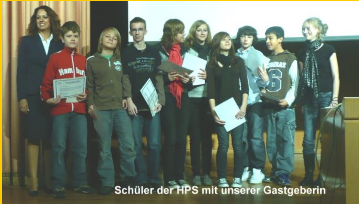
Schüler der HPS mit unserer Gastgeberin

Zum Abschluss gab es dann am Anleger in Ortaköy leckere gefüllte Kartoffeln, dann folgte eine sehr schöne Bootsfahrt auf dem Bosphorus. Der Regen setzte zu unserem Glück erst ein, als wir wieder an Land waren.