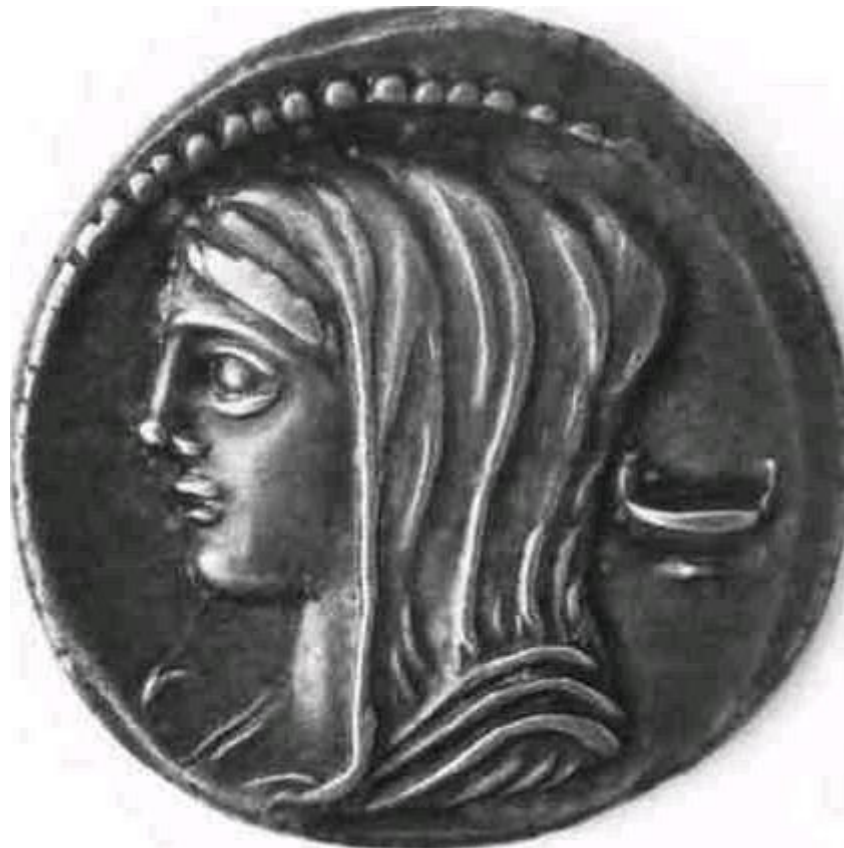
Kopf der Vesta, Vorderseite eines Denars, Rom, 63 v. Chr.

Vesta war eine altitalische bzw. römische Göttin des Herdfeuers, des häuslichen Segens und die Beschützerin der Familie. Sie war eine der wichtigsten Göttinnen des römischen Staatskultes. Sie hatte in Rom einen Rundtempel auf dem Forum Romanum mit ewig brennendem Feuer, das der Sage nach ursprünglich aus Troja stammte. Sie war die älteste Tochter von Rhea und Kronos und war demnach eine Schwester von Zeus/Jupiter. Apollon und Neptun hielten um ihre Hand an, aber sie lehnte beide Male ab und blieb jungfräulich. Das brennende Licht im Vesta-Tempel war das Zeichen ihrer Jungfräulichkeit. Vesta gilt als Erfinderin der Häuser. Um das zu verehren, wurde an jedem Neujahrstag die neu zu entzündende Herdfeuerflamme aus dem Vesta-Tempel in die Häuser gebracht.