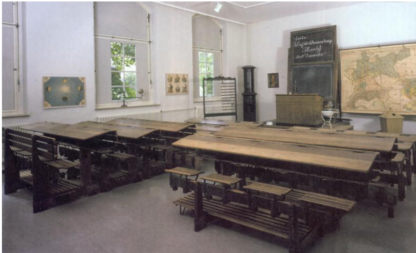
Los pupitres con mesas

Antes los chicos iban al colegio la primera vez cuando tenían seis años. El colegio de mi abuela era muy viejo. Había tres clases y en todas las clases alumnos de diferentes edades estudiaban juntos. En el colegio había sólo tres profesores. Los alumnos estaban sentados en pupitres con mesas. En todos